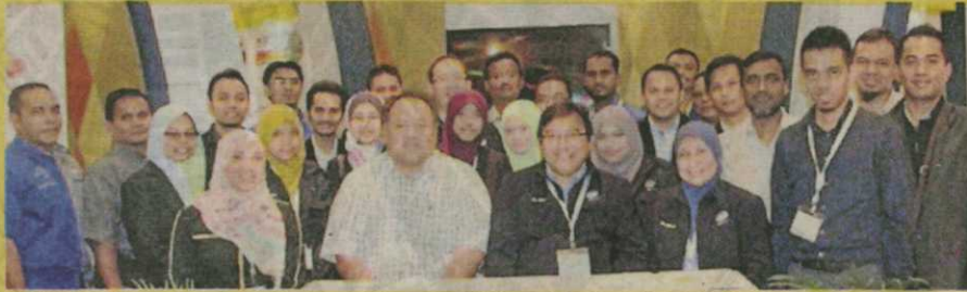
UniMAP bangga dengan pencapaian penyelidikinya dalam BioMalaysia 2013.

Johor Bahru: Universiti Malaysia Perlis (UniMAP) membolot tiga pingat emas dalam Seminar BioMalaysia dan Bioekonomi Asia Pasifik (BioMalaysia) 2013.