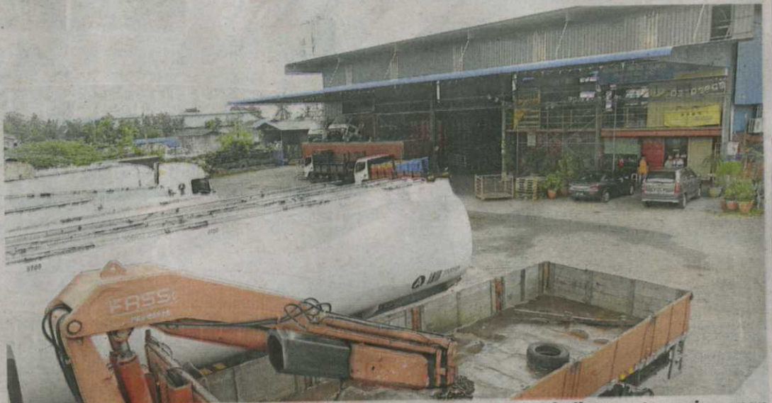
Sebuah gudang di Jalan Alor Setar-Sungai Petani yang dipercayai menjadi tempat penyimpanan minyak diesel dan petrol diserbu dalam operasi OD1N, semalam.

Ketua Pengarah, Bahagian Penguatkuasaan, Kementerian Perdagangan Dalam Negeri, Koperasi Kepenggunaan (KPDNKK), Mohd Roslan Ma-